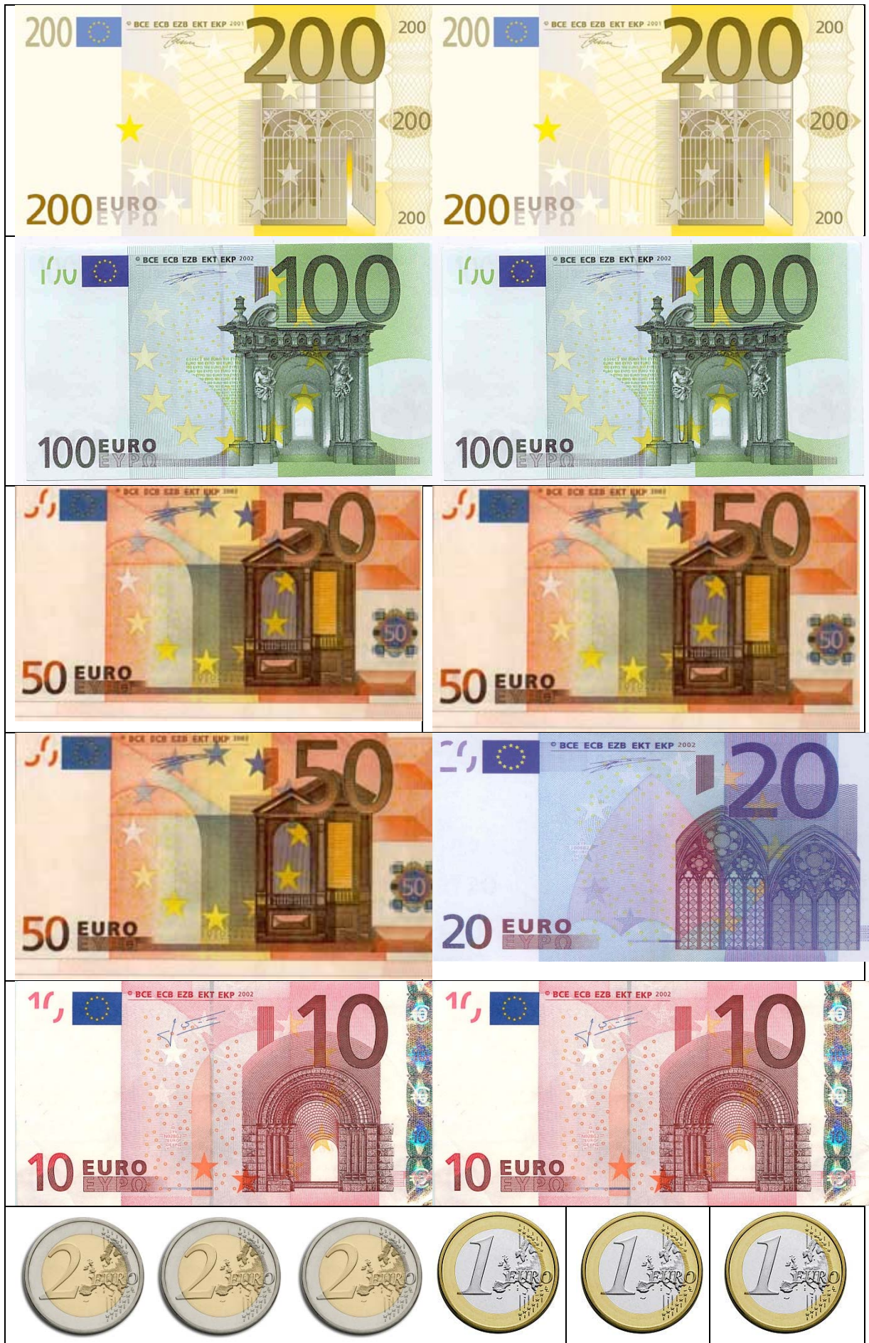
Bargeld in der Kasse